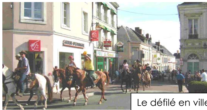
Le défilé en ville

Un grand merci, pour le travail de toute l'équipe de bénévoles du 72.